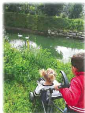
Petite balade dans la campagne et belle rencontre !