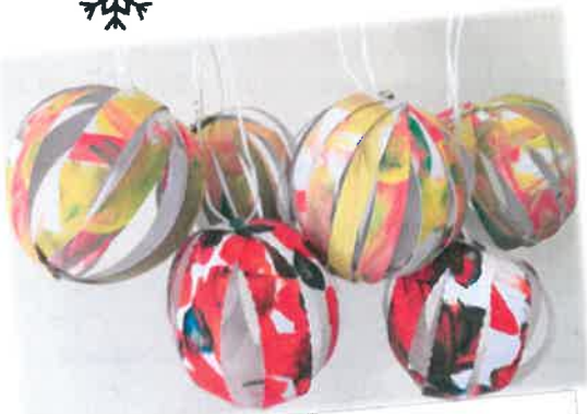
Boules de Noël Par l'asso des nounous de Roche !