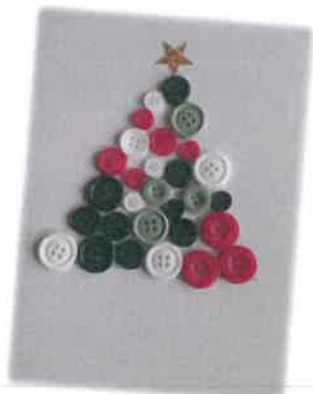
Sapin de Noël en bouton Chez Stéphanie !