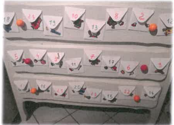
Idée de « commode de l'avent » Chez Aurélie