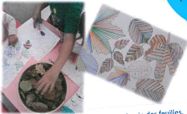
Balade en forêt puis dessin des feuilles. Chez Sylvie

Pour connaître les tarifs, merci de contacter la ludothèque par mail: ludo.latoupie@famillesrurales.org