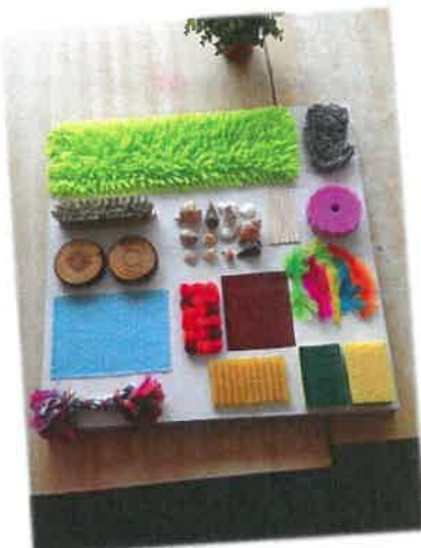
Panneau de Sylvie