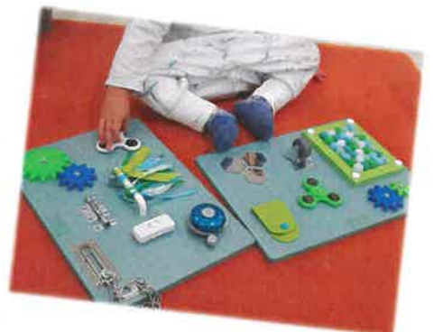
Panneau sensoriel du Relais

Il permettra aux enfants de développer leurs sens du toucher en découvrant des textures différentes, ainsi que la vue, l'ouïe et leur motricité fine.